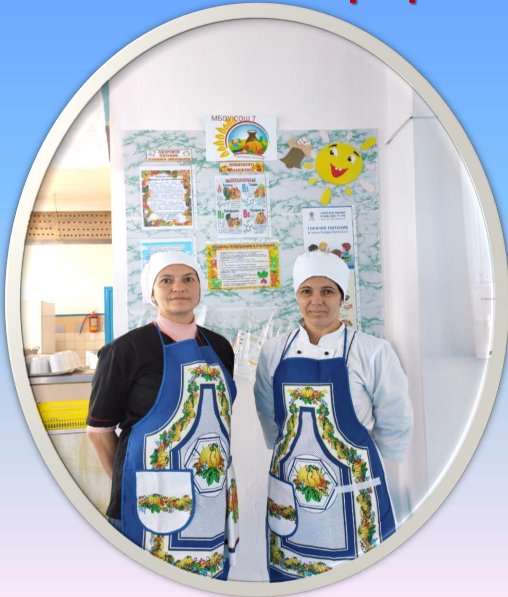
График питания учащихся